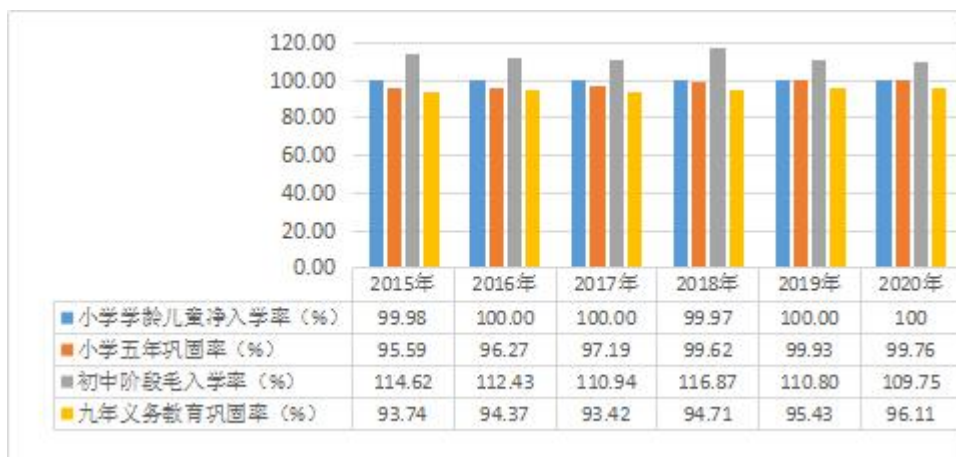
图 1 义务教育阶段入学情况

二是在校学生人数创新高。近年来，广东印发《广东省推进义务教育优质均衡发展行动方案》《全面加强乡村小规模学校和乡镇寄宿制学校建设的实施意见》，进一步统筹城乡教育资源，努力增加中小学学位供给，扩大优质教育资源覆盖面，全面消除大班额，保障适龄儿童入学权利，补齐义务教育短板，整体提升义务教育办学条件和教育质量，加快促进义务教育优质均衡发展。截至2020年，全省小学10600所，比2015年增加474所，在校学生人数1057.11万人，比2015年末增加188.23万人，增长21.7%；普通初中3748所，比2015年增加333所，在校生成数405.47万人，比2015年末增加50.15万人，增长14.1%。（见表1）