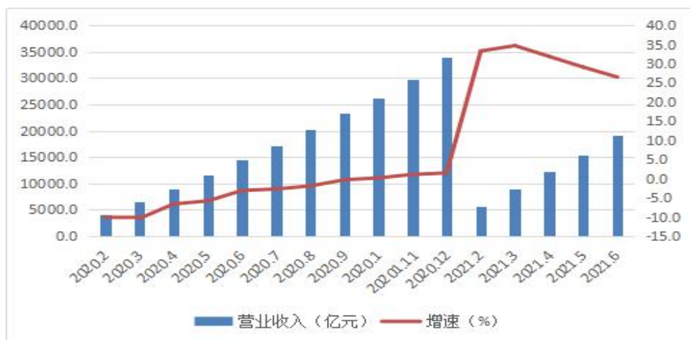
图 1 2020 年以来广东规模以上服务业营业收入及增速

(二) 产业强支撑，基本盘稳固。上半年，广东信息传输和软件产业、交通运输仓储邮政业、租赁和商务服务业三大支柱产业稳健增长，合计实现营业收入 14844.42 亿元，占全部规模以上服务业的 77.5%；同比增长 26.6%，两年平均增长 11.1%，比一季度提高 1.3 个百分点，服务业恢复增长的基本盘稳固。其中，信息传输、软件和信息技术服务业营业收入 6611.73 亿元，增长 20.2%；两年平均增长 14.7%，高于一季度 1.3 个百分点。交通运输、仓储和邮政业营业收入 4965.71 亿元，同比增长 33.7%；两年平均增长 8.3%，高于一季度 2.1 个百分点。租赁和商务服务业营业收入 3266.98 亿元，同比增长 30.0%；两年平均增长 9.1%，与一季度持平。腾讯、南航、广铁、前海新之江、网易等重点企业保持平稳较快增长。