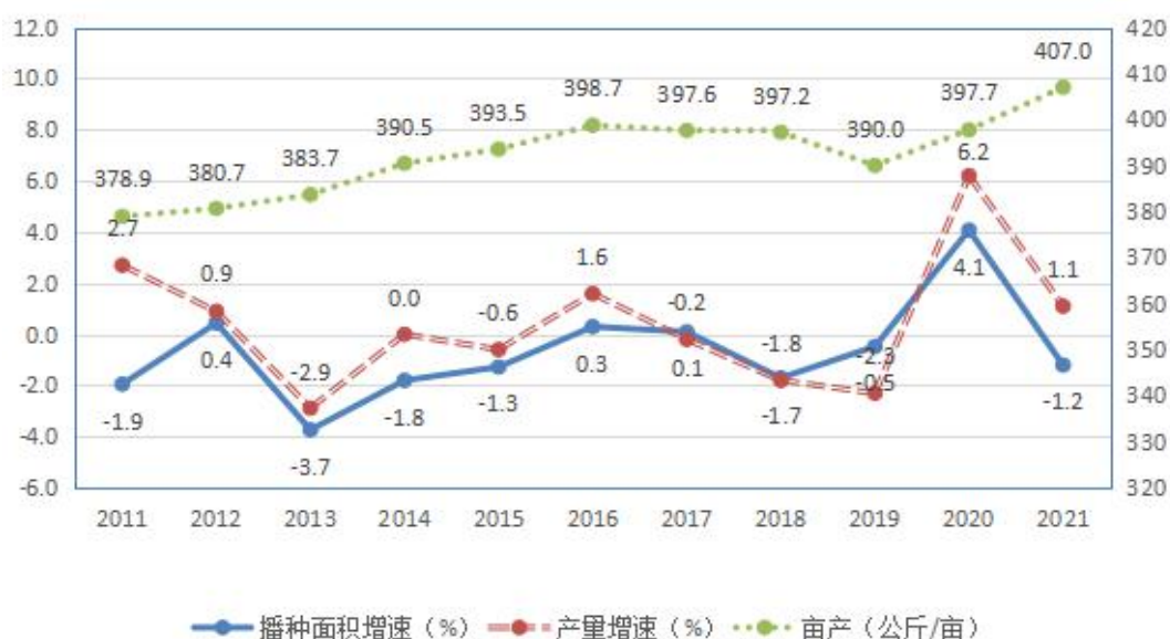
图 1 2011 年以来广东早稻播种面积、产量增速和亩产情况