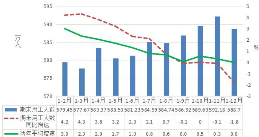
图 3 2021 年广东规模以上服务业期末用工人数及增速