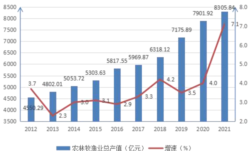
图1 2012—2021年广东农林牧渔业总产值及增速

党的十八大以来，广东农业经济总量加快发展壮大，农业经济总量稳步提升，总产值连续跨越5000亿元、6000亿元、7000亿元关口，2021年首次突破8000亿元，达8305.84亿元，是2012年的1.4倍，2013—2021年年均增长3.7%。（见图1）