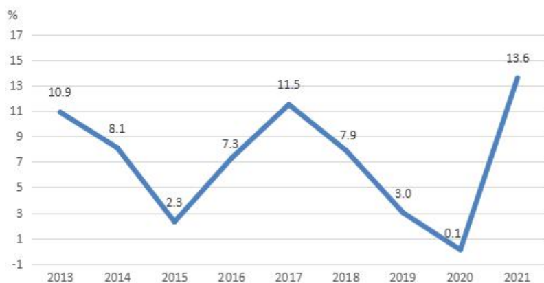
图 5 2013—2021 年广东规模以上工业企业营业收入增速

年的 22 个增加到 37 个，营业收入超万亿的行业增加到 2 个，分别为计算机通信和其他电子设备制造业、电气机械和器材制造业，2021 年分别实现营业收入 46395.14 亿元、19904.06 亿元。2021 年，广东规模以上工业企业营业收入同比增长 13.6%，继 2017 年后再次突破 10%，为党的十八大以来最高点。2013—2021 年，广东规模以上工业企业营业收入年均增长 7.1%，整体呈波动上涨态势。（见图 5）