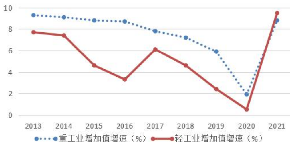
图 3 2013—2021 年广东规模以上轻、重工业增速

长 7.5%，较同期轻工业高 2.4 个百分点，较同期规模以上工业增加值增速高 0.9 个百分点。2021 年，重工业占全部规模以上工业增加值比重 66.6%，比 2012 年提高 5.8 个百分点。（见图 3）