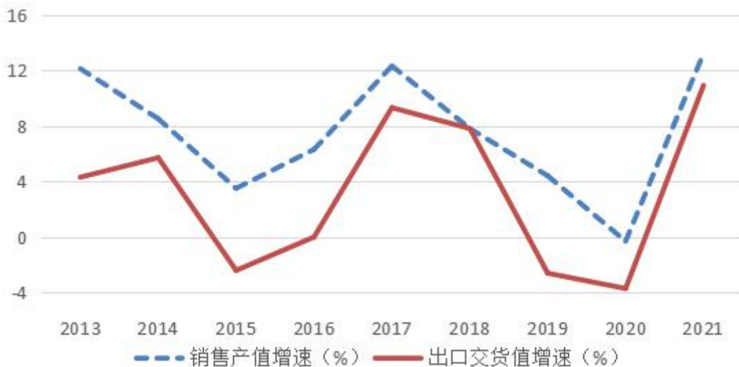
图 4 2013—2021 年广东规模以上工业销售情况

内销保持增长，占比提高。党的十八大以来，为降低海外需求收缩、生产成本上升带来的影响，广东主动作为，出台出口退税政策，鼓励行业自救，扶持电商直播发展，国内工业品销路有所扩大。2017 年，广东规模以上工业内销产值首次突破 10 万亿元，2021 年实现 127106.78 亿元，比 2012 年翻了近一番，占销售产值的 77.2%，比 2012 年提高 8.4 个百分点。2013—2021 年规模以上工业内销产值年均增长 9.1%，高于同期出口交货值增速 1.7 个百分点。