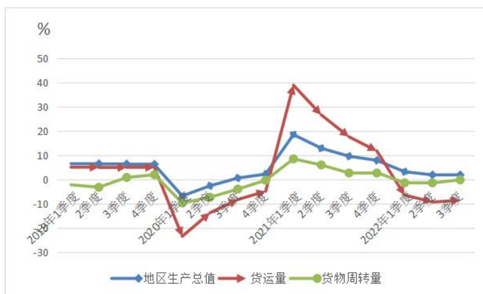
图 1 2019 年以来广东货运主要指标与地区生产总值累计增速

前三季度，广东完成货运量 26.79 亿吨，同比下降 8.5%，降幅比上半年收窄 0.7 个百分点，其中，7 月、8 月分别下降 8.7%、7.3%，9 月降幅收窄至 5.4%；完成货物周转量 19712.55 亿吨公里，下降 0.1%，降幅比上半年收窄 1.3 个百分点，其中，7 月、8 月、9 月分别增长 1.2%、3.3%、2.3%。（见图 1、表 1）