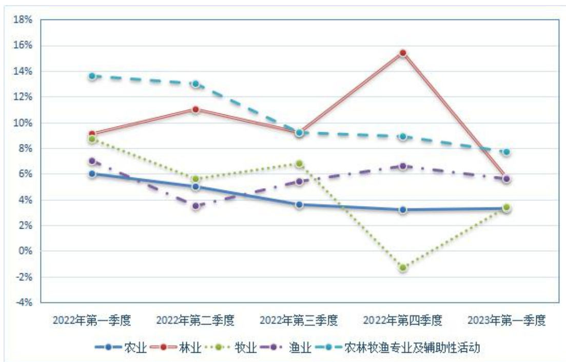
图 1 2022 年以来季度广东农林牧渔业产值增速