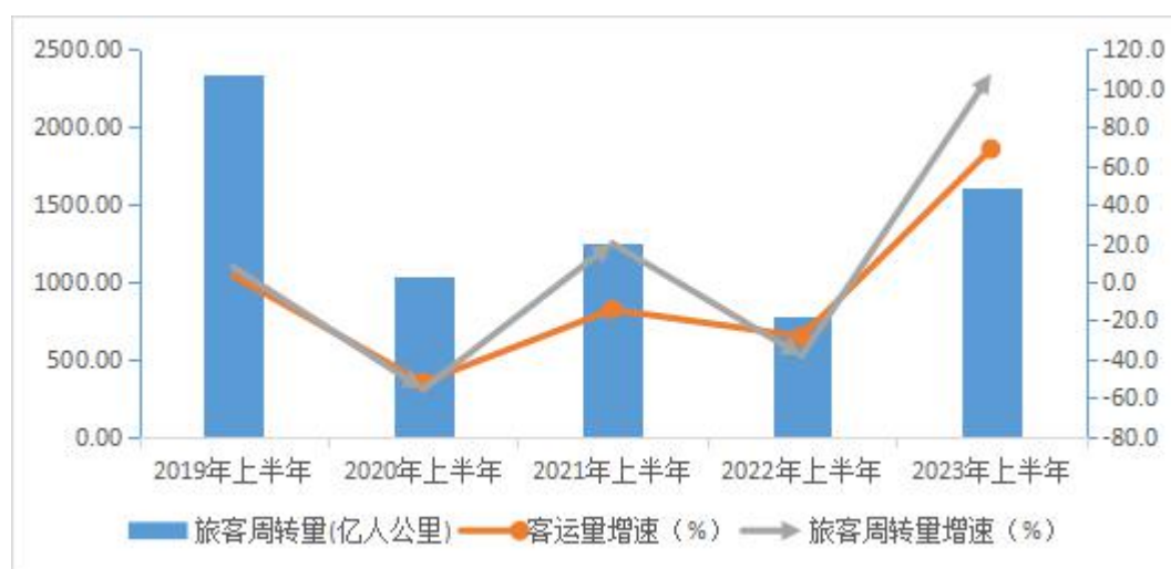
图 2 2019 年以来广东客运生产指标情况